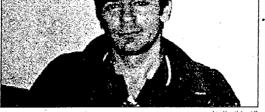
القاهرة - من كتابات ثابت